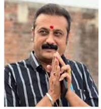
શ્રી અંબરીષ ડેર હોસ્પિટલના સ્થાપક સ્વપ્રદ્રષ્ટા, પૂર્વ ધારાસભ્ય શ્રી - રાજુલા અને સમાજ સેવક