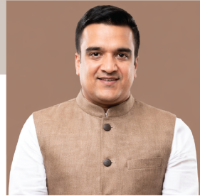
શ્રી હર્ષભઈ સંઘવી (માનનીય ઉપમુખ્ય મંત્રી શ્રી - ગુજરાત રાજ્ય)